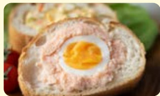
ゆでたまごの2way スタフドバケット