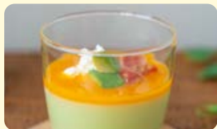
濃厚卵ジャムをかけた 卵白アボカドムース