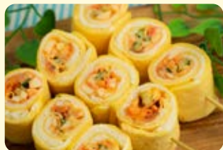
カレー風味の野菜たまごロール