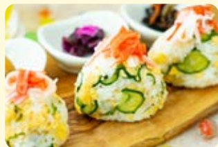
炒り卵と胡瓜のさっぱりおにぎり