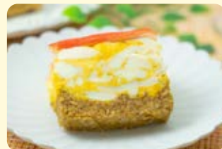
甘酢あんかけ 卵テリーヌ風